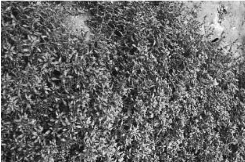
Amaranthus blitoides registró una frecuencia del 24% en los viñedos de la D.O. «Campo de Borja».