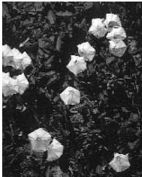
Convolvulus arvensis superó el 30% de frecuencia relativa en los viñedos de la D.O. «Campo de Borja».