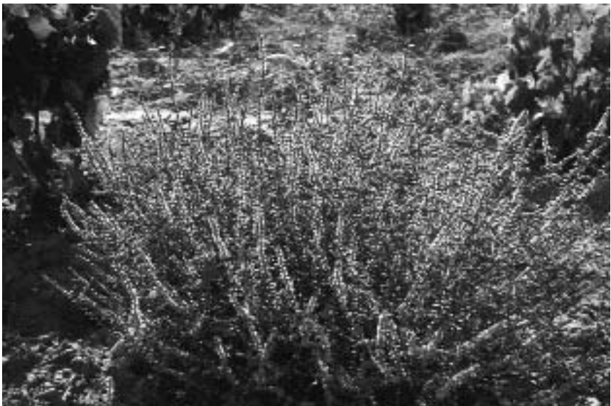
Salsola kali fue de las más importantes en cuanto a presencia pudiendo llegar a competir fuertemente por el agua dado el tamaño que puede alcanzar.