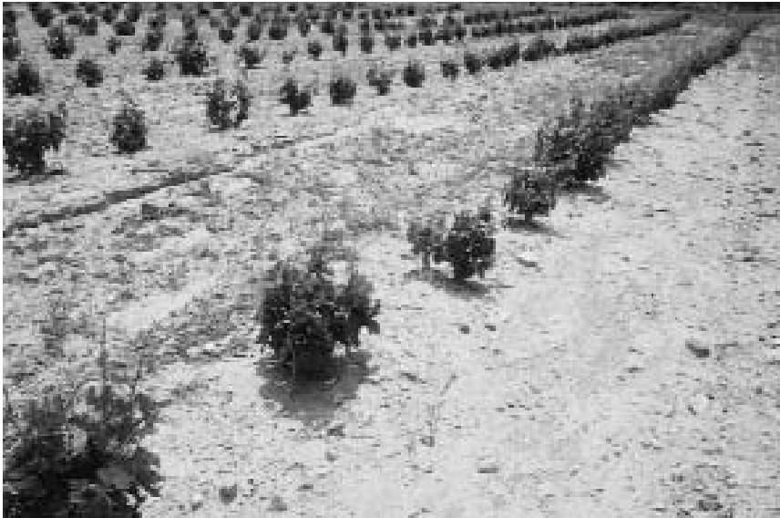
Riesgos del laboreo excesivo. Muestra de la erosión producida tras una tormenta en un viñedo de Ainzón.