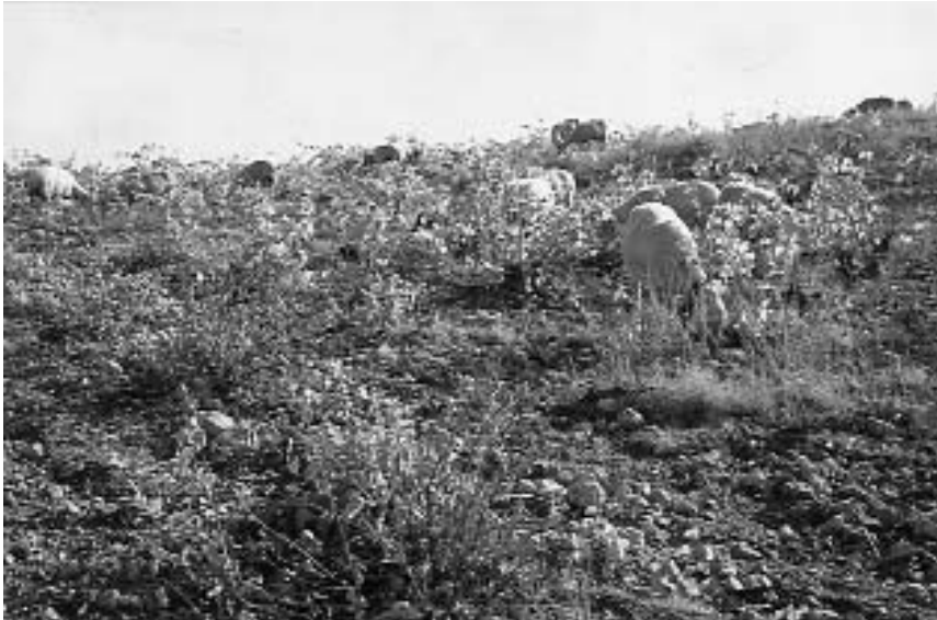
Viticultura sostenible. Viñedo del Campo de Borja pastando el ganado (Ainzón).