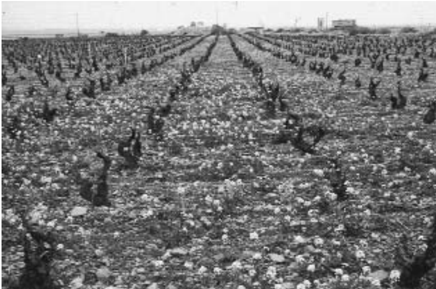
Aspecto de un viñedo en primavera infestado por Diplotaxis erucoides . Magallón (Zaragoza).